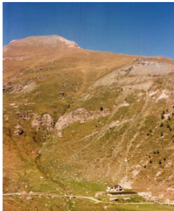
▲ Alpe Jouglard

Dal rifugio (2023 m) imboccare il sentiero 339 che, dopo aver attraversato il torrente, risalito il pendio antistante il rifugio e oltrepassato il costone, conduce in breve al Lago Laus (m 2271) e successivamente al lago La Manica (m 2365).