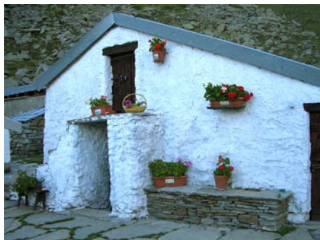
◀ Alpe Selleries

Eventi: Tutti gli anni si festeggia S. Anna il 26 luglio a Puy e la Madonna delle Nevi la prima domenica di agosto a Pequerel. L'ultimo fine settimana di settembre: Festa del Plaisentif, organizzata dal Rifugio Selleries e dal Parco Orsiera Rocciavrè presso l'Alpe Selleries.