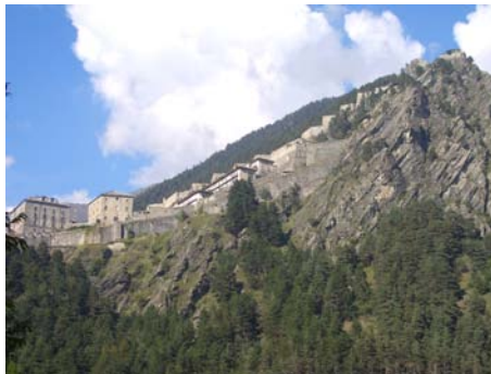
▲ Forte di Fenestrelle